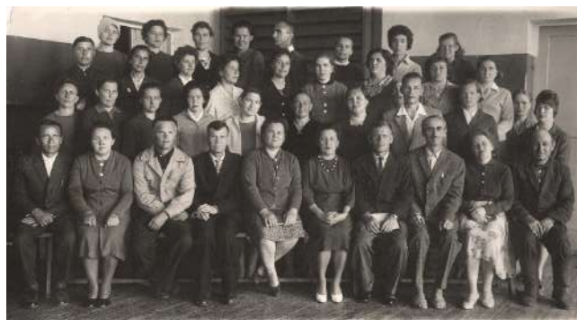
На фото педагогический коллектив школы №8 в 1965 году

Приказом № 3 от 07.01.1965г. по Ирбитскому ГорОНО директором восьмилетней школы №8 г. Ирбита был назначен Г.Ф. Мирофоров. (продолжение следует)