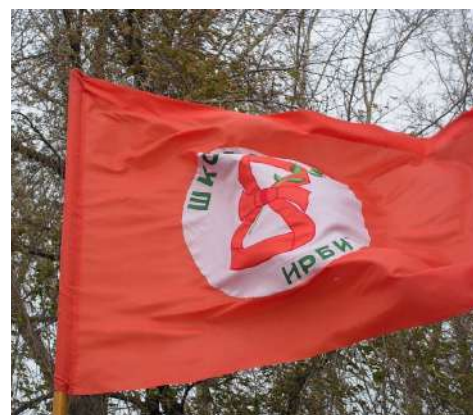
ПЕРВЫЙ ШКОЛЬНЫЙ ФЛАГ

III. В МИРЕ ШКОЛЫ ВСЕ НЕ ПЕРЕЧЕСТЬ, МОЖЕТ ГДЕ-ТО ЛУЧШЕ НАШЕЙ ЕСТЬ. НО ВОСЬМАЯ ВСЕХ МИЛЕЙ, ЛИШЬ ПОДУМАЕМ О НЕЙ, И СРАЗУ СТАНЕТ НА ДУШЕ ТЕПЛЕЙ.