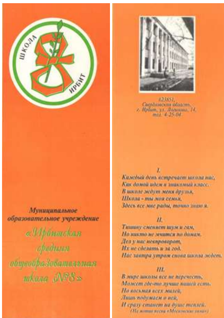
ПЕРВАЯ ЗАКЛАДКА С СИМВОЛИКОЙ И ГИМНОМ ШКОЛЫ БЫЛА НАПЕЧАТАНА В 2001 ГОДУ