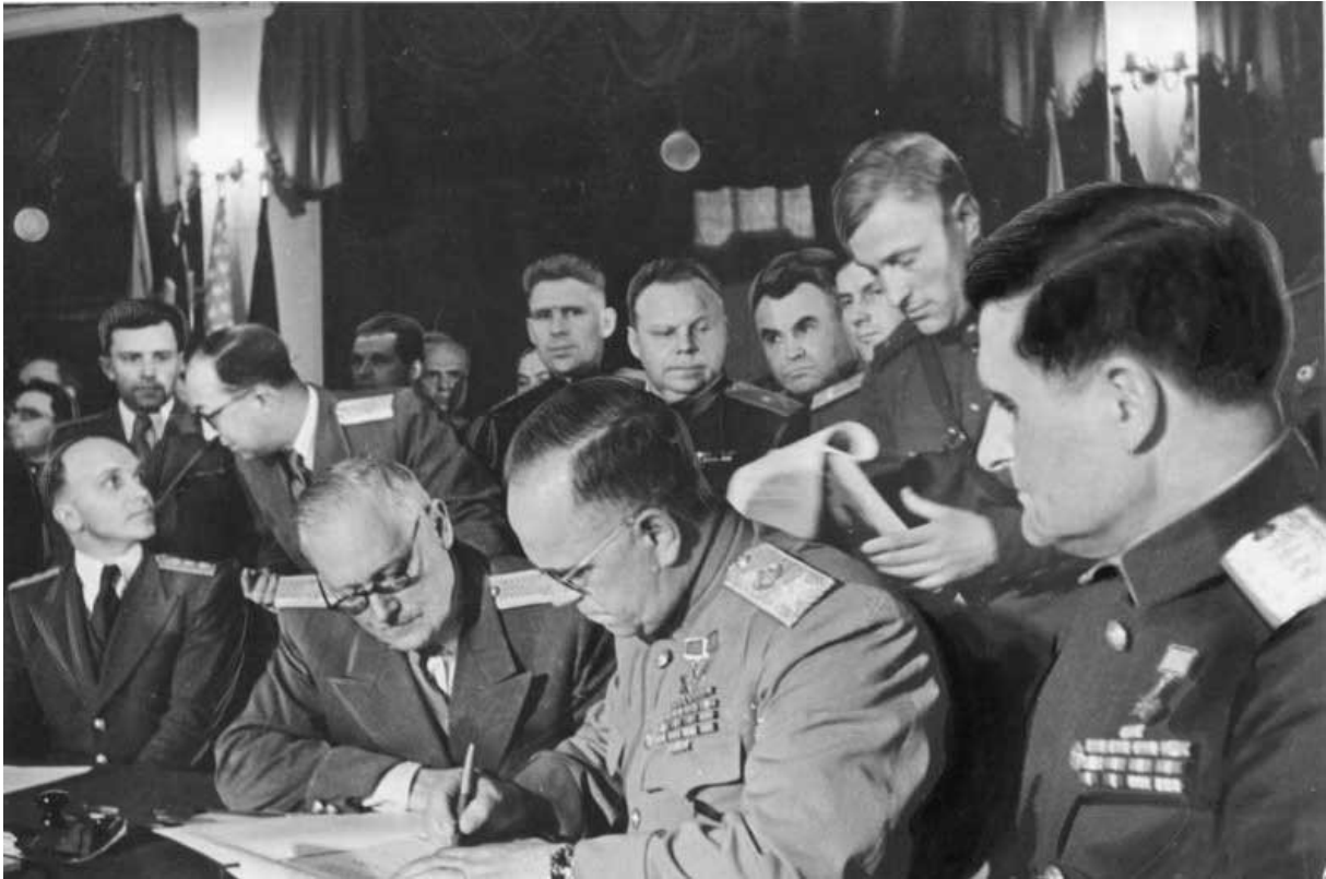
8 мая 1945 года в 22:43 (9 мая 0:43 по мск.вр.), Карлсхорст (Берлин) Жуков принял безоговорочную капитуляцию Германии

В октябре 1944 г. Сталин назначил Жукова командующим Первым Белорусским фронтом, который должен был наступать на Берлин. Завершающие бои Великой Отечественной были ожесточенными: столицу Германии защищали эсэсовцы из разных стран. Ко 2 мая над Рейхстагом был водружен Красный флаг, а 8 мая Жуков от имени Верховного главнокомандования Красной Армии принял безоговорочную капитуляцию Германии .