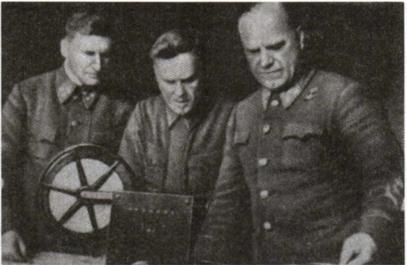
Генерал Г. К. Жуков (справа) в период обороны Москвы